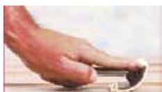
Vagga långsamt ner...