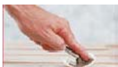
Dra verktyget mot dig