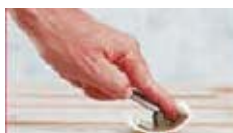
och upp, konsekvent,