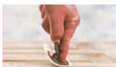
Tryck med pek fingret

Rör om ZAR® Oljebaserad Träbets ordentligt. Lägg på ett tunt slätt lager ZAR® Träbets med en tygtrasa. Tryck med pek fingret på verktyget mot den underliggande ytan. Vagga ner ådringsverktyget samtidigt som du drar det mot dig i en konstant hastighet. Vagga därefter fram och tillbaka samtidigt som du fortsätter att dra. Fortsätt tills ytan är klar. Det är viktigt att inte stanna upp. Om du gör fel är det ingen fara. Lägg bara på mer bets på ytan och ådra igen. Eller ta bort allt du har lagt på med en trasa fuktad med lacknafta och börja om.