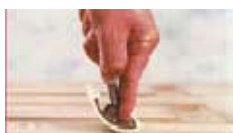
tills sektionen är klar.